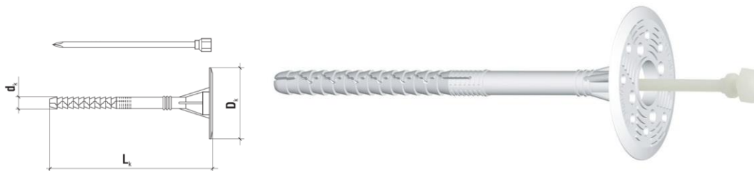
Дюбел за изолация с пластмасов пирон LFN