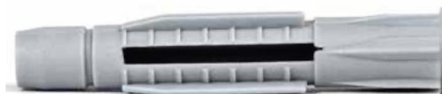
Дюбел универсален с цилиндрична яка UH-L